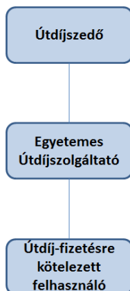
1. ábra - Útdíjszedő, az Egyetemes Útdíjszolgáltató és az Útdíj-fizetésre kötelezett felhasználó közötti szerződéses viszony

Az Útdíjszedő, az Egyetemes Útdíjszolgáltató és az Útdíj-fizetésre kötelezett felhasználó közötti szerződéses viszony az alábbi ábra szemlélteti: